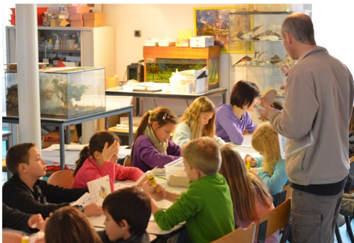
Atelier nature en petits groupes