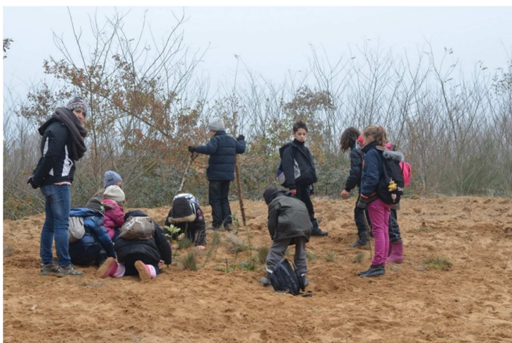
Sortie aux dunes de sable de Sermoyer