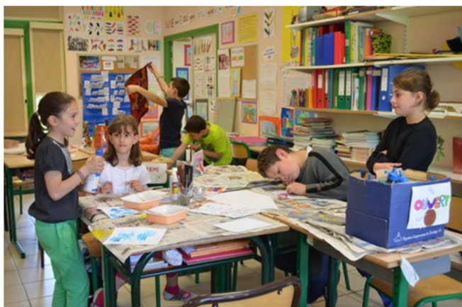
Marché de connaissances.