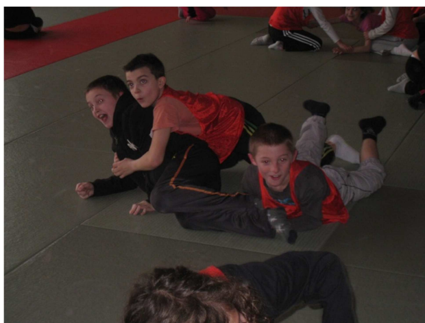
Jeux d'opposition aux Nivres à Pont de Vaux.