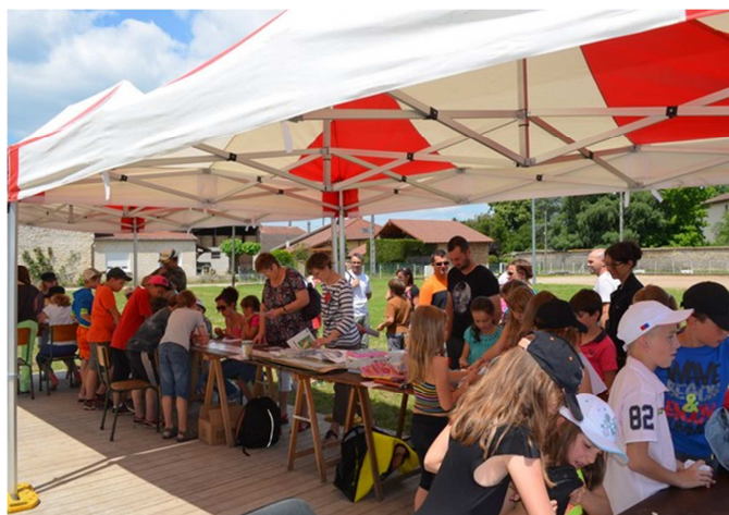
Fête des écoles du RPI.