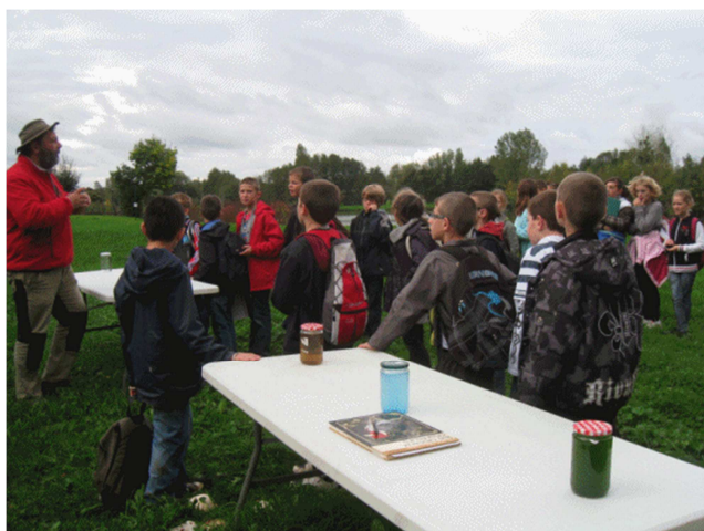
Fête de la science à Pont de Vaux.