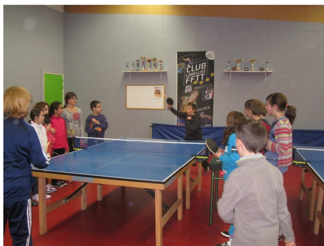
Tennis de table.