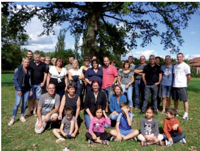
Journée détente de l'amicale avec les actifs, les anciens pompiers et leurs conjoints